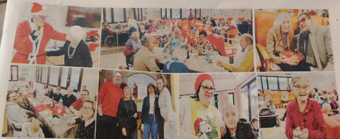
Alcuni momenti del pranzo di Natale alla casa di riposo Patriarca di Gattinara

GATTINARA Giornate intense e cariche di emozioni quelle vissute alla casa di riposo Patriarca di Gattinara. Il Natale è diventato occasione di incontro, vicinanza e condivisione nella struttura cittadina. Venerdì scorso la residenza ha accolto una visita davvero speciale: i "nipoti di Babbo Natale", che hanno portato allegria e calore tra gli ospiti, regalando sorrisi e momenti di spensieratezza. La loro presenza ha trasformato una giornata ordinaria in