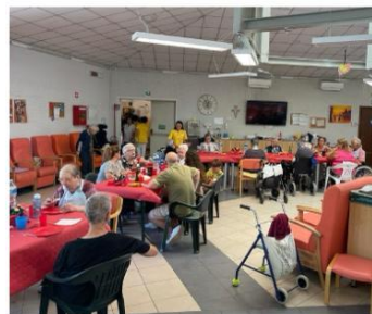
Un momento di socializzazione alla Casa di riposo Patriarca

ventano così ponti di relazione, dove la semplicità crea memoria e affetto. E non è finita qui. La residenza sta già lavorando al rilancio dell'iniziativa "Nipoti di Babbo Natale", un progetto nazionale che permette agli anziani di esprimere un desiderio da realizzare a Natale, grazie alla generosità di volontari anonimi. «Negli anni scorsi ha portato tanta gioia - racconta la presidente -. Vogliamo riproporla, con la stesura delle letterine da mandare ai volontari, che poi potranno realizzare un piccolo sogno durante le festività. E un'iniziativa che scalda il cuore». Desideri semplici, ma pieni di significato: un libro, un indumento, un profumo del passato, una carezza simbolica. Ogni dono racconta